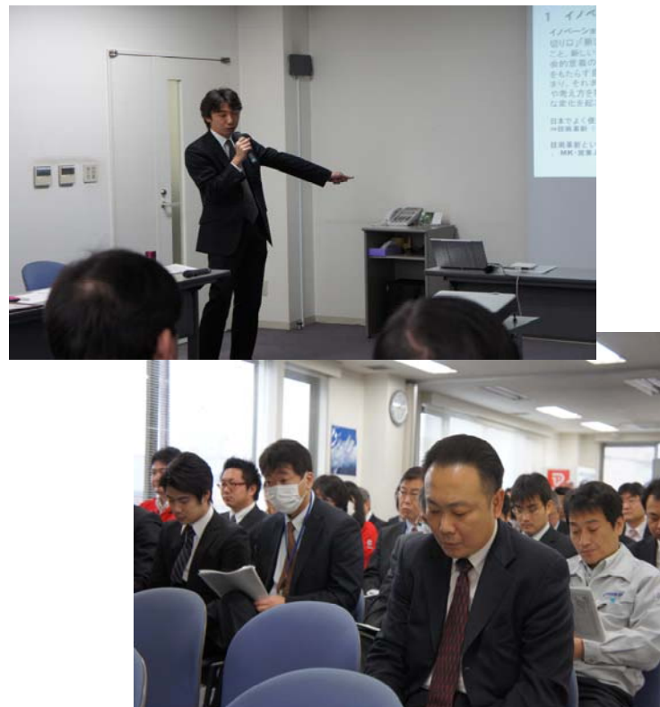
(注)SSG2011年度「経営事業報告会」で発表されました。