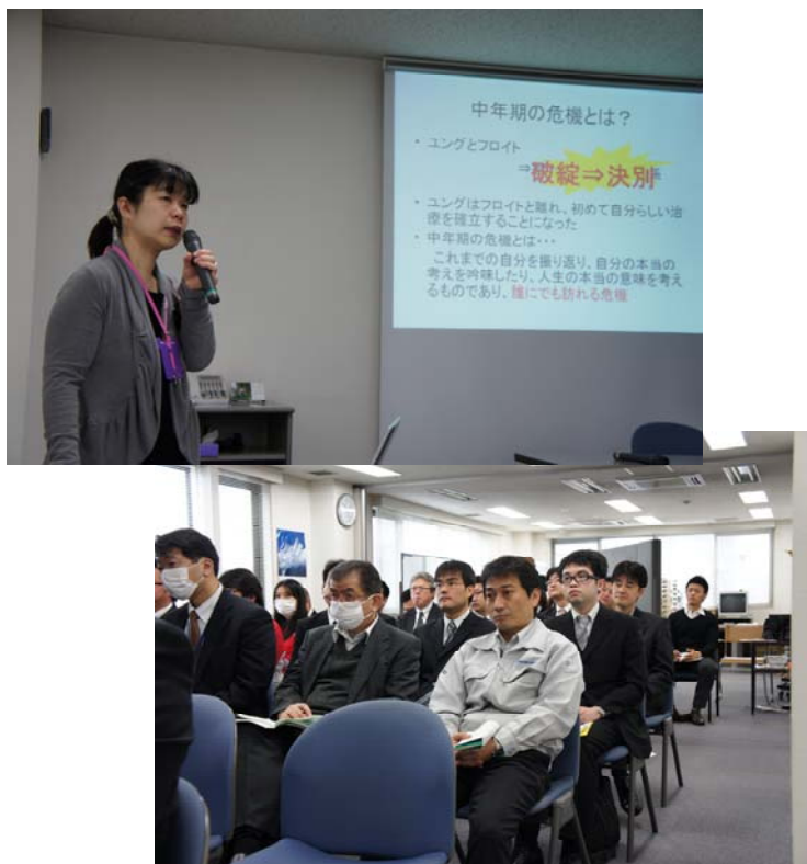
(注)SSG2011年度「経営事業報告会」で講義されました。