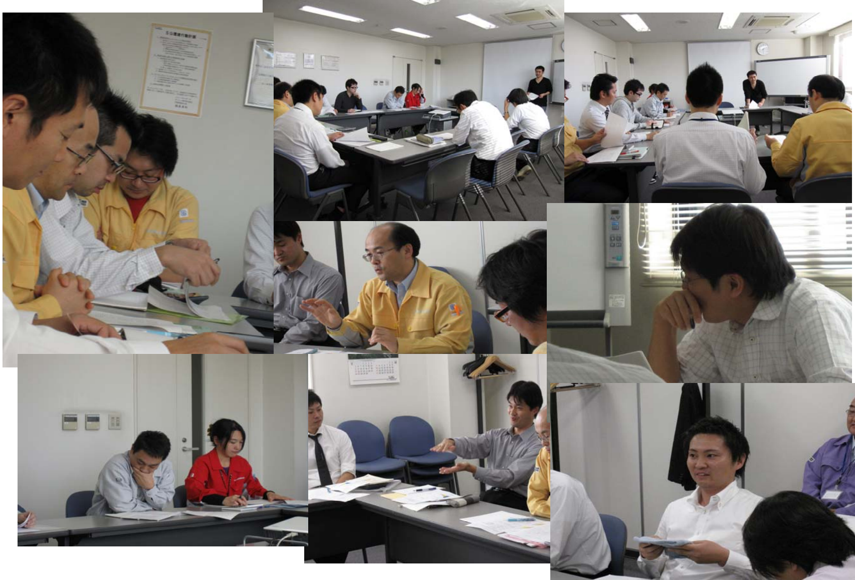
(注)第3回、第4回の講義写真は、掲載していません。(講師との質疑応答)