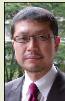
サンシングループ 代表